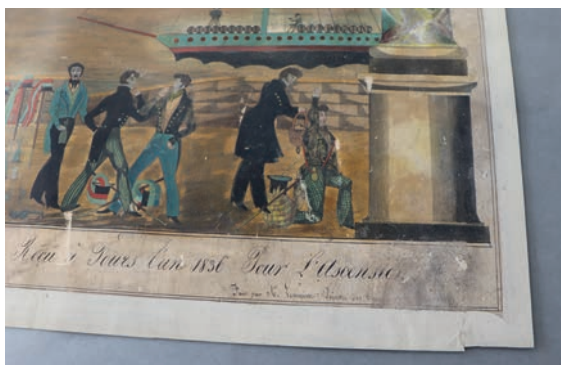
L'humidité a provoqué des moisissures qui ont détérioré l'œuvre, rendant une partie du texte illisible

Ces interventions délicates seront menées par des restaurateurs formés pour intervenir sur les collections « musées de France ».