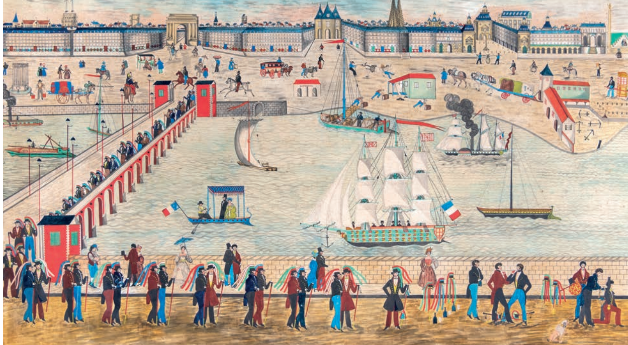
Auguste Lemoine, Champ de conduite appartenant aux bondrigles compagnons passants couvreurs de la ville d'Orléans , dessin aquarellé, 1839