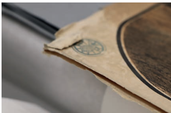
Les supports sur lesquelles certaines œuvres ont été collées pour les rigidifier doivent être retirés car ils endommagent les œuvres