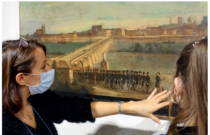
Visite commentée des conduites exposées au Musée

Il attire notamment un public familial et touristique. Il propose visites, expositions et animations autour des thèmes des métiers, de l'histoire du compagnonnage, des grands chefs-d'œuvre du musée ou de compagnons célèbres. Il organise aussi des rencontres entre visiteurs et compagnons, notamment lors des Journées du patrimoine. Il offre aux jeunes publics, notamment aux écoles, un large choix d'animations et ateliers permettant de découvrir le compagnonnage, les métiers, l'artisanat... Il dédie aussi des contenus adaptés aux publics empêchés, particulièrement aux apprenants en langue française.