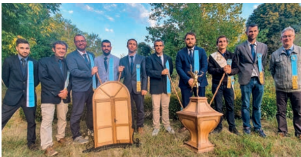
Jeunes reçus compagnons menuisiers et leurs travaux de Réception lors de la Sainte-Anne 2020

Le compagnonnage est un ensemble d'associations (appelées sociétés ou mouvements, à caractère initiatique) d'ouvriers d'une trentaine de métiers artisanaux ou industriels : métiers de la pierre, du bois, du métal, du cuir et des textiles, métiers de bouche... Ils ont pour identité commune la solidarité entre les membres, le perfectionnement professionnel et la transmission de valeurs morales. Cette transmission s'opère de façon originale : le jeune ouvrier qui entre dans une société voyage durant plusieurs années pour continuer d'apprendre son métier, rencontrer ses pairs, vivre en communauté, se construire professionnellement et personnellement : c'est le Tour de France . A l'issue de cette itinérance, il soumet à ses aînés un travail de Réception , prouvant ses qualités de travailleur autant que ses qualités humaines. Il est alors « reçu » compagnon du Tour de France, reçoit un nom compagnonnique rappelant sa région de naissance et l'une de ses qualités (ex : Tourangeau la Sagesse), une canne et des couleurs (rubans).