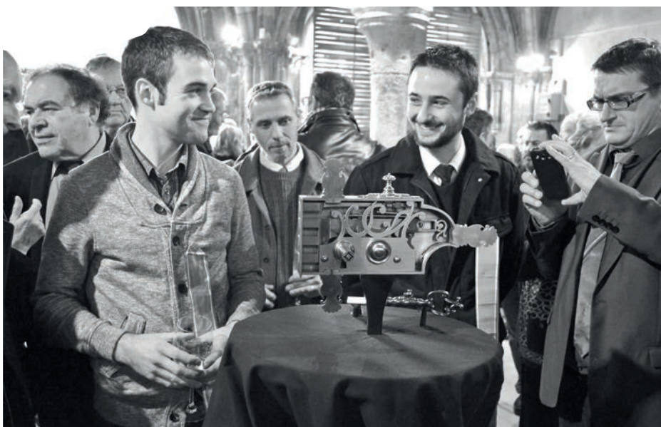
Deux aspirants présentant leur travail, serrure à clé-pistolet, en 2016 au Musée de Tours

http://fondation-patrimoine.org/oeuvres-du-musee-du-compagnonnage-a-tours