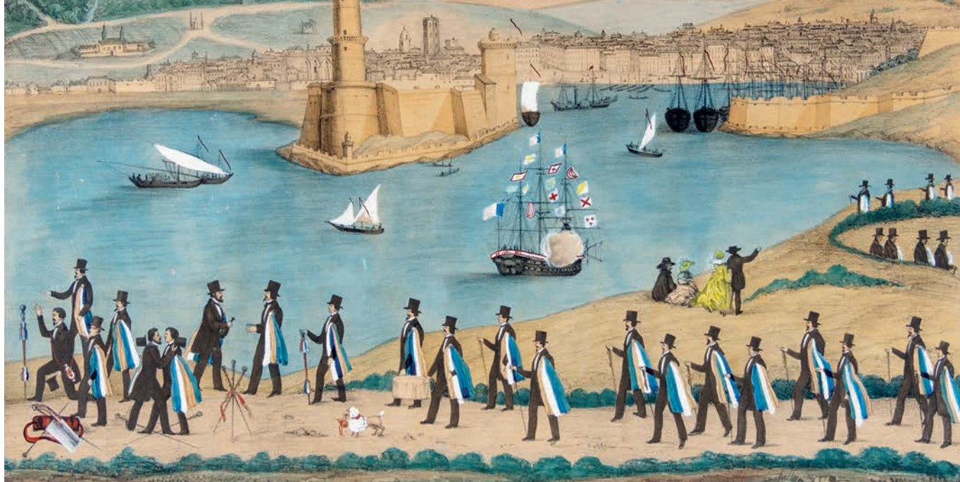
Boehm et fils (lithographes), Scène de conduite à Marseille , lithographie, vers 1900