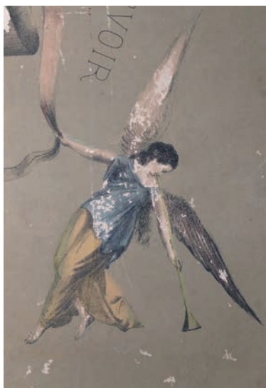
Les insectes comme le poisson d'argent se nourrissent de papier, provoquant des petits trous