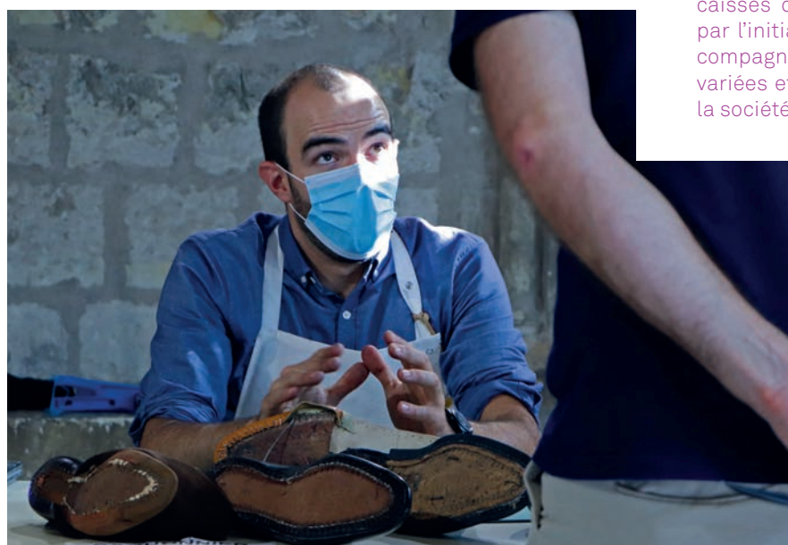
Un aspirant cordonnier-bottier lors des Journées du patrimoine 2020 au Musée de Tours