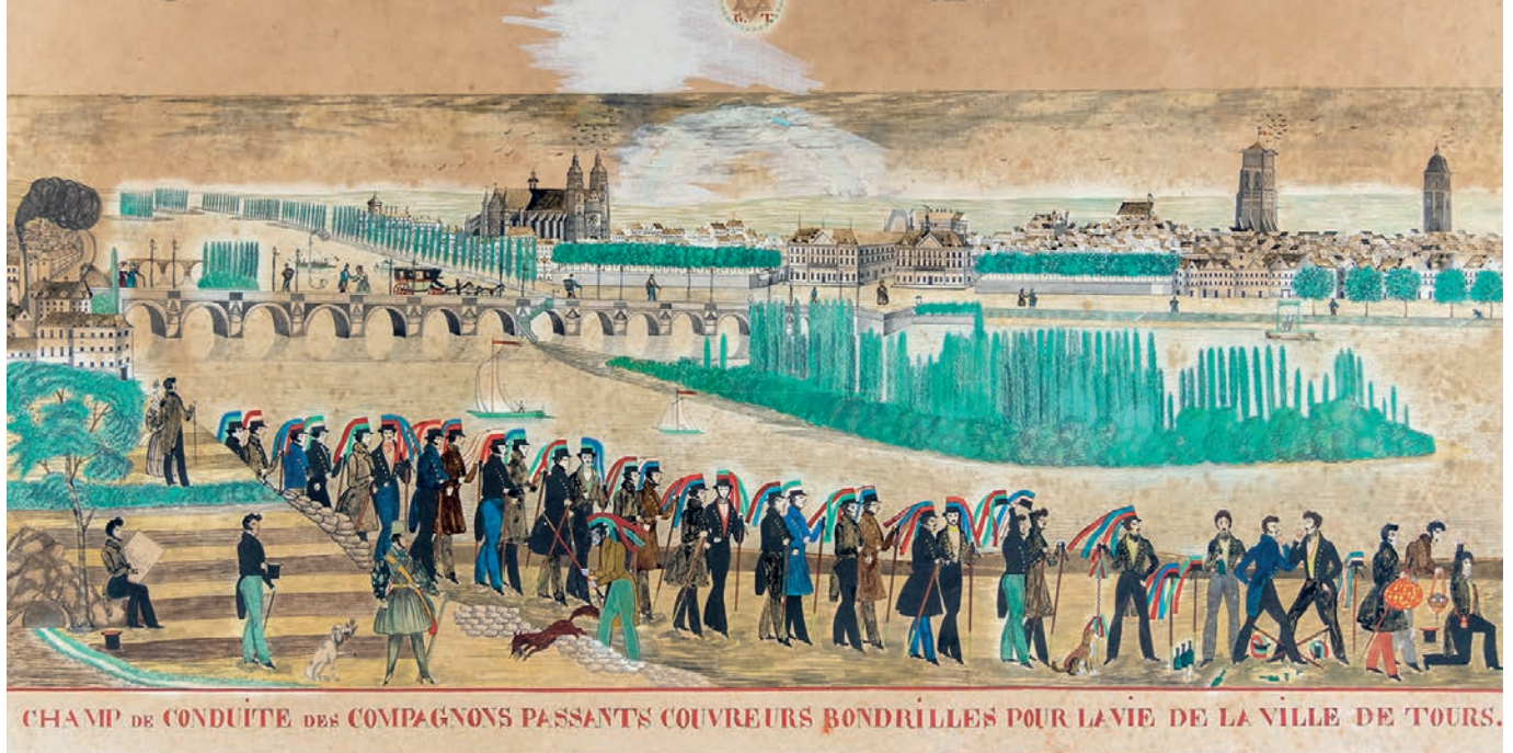
Auguste Lemoine, Champ de conduite des compagnons passants couvreurs bondrilles pour la vie de la ville de Tours , dessin aquarellé, 1838