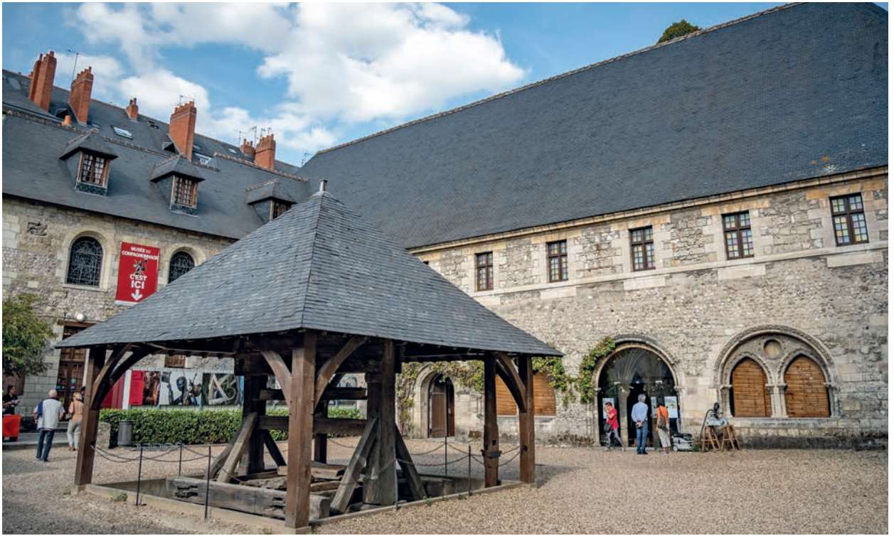
Le Musée du Compagnonnage de Tours