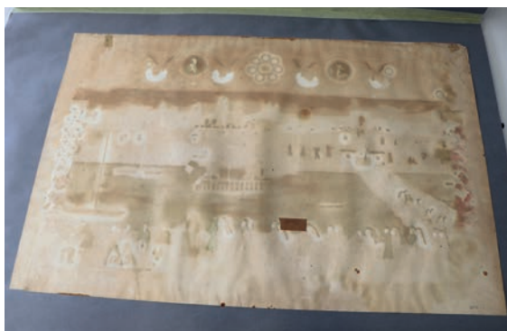
Au revers de l'aquarelle, on distingue le gondolement généralisé de l'œuvre, des tâches et des auréoles, des déchirures réparées au scotch, une forte oxydation du papier